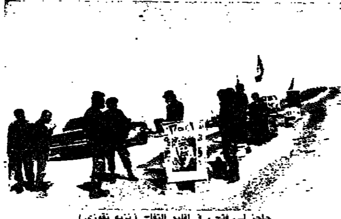
حاجز ل. فتح. في اقليم التفاح (تزييه نفوزي)

فمن ابلج وجه الرئيس اليراققي. الخاتمة والنصف مساء امس. رسالة الى اللبنانيين. وصفها بانها مع اطلالة العام الجديد. وفي مستهل العهد. حديث القلب والعقل. وأشار الى الاتهامات الشامل وعلى المستويات كافة في لبنان. وترى وهنا غاب دوره ووزنه في المنطقه والعالم. (البقية على الصفحة ١١)